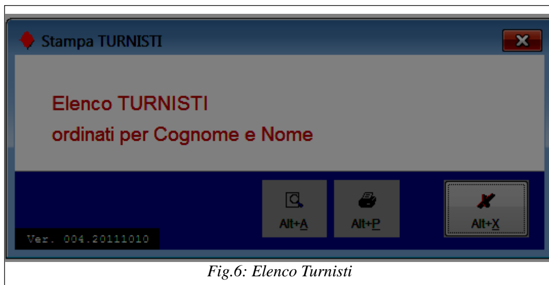
Fig.6: Elenco Turnisti